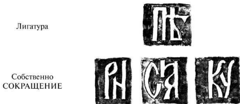
Рис. 4. Знаки препинания, надстрочные знаки и титла в изразцах надписи в крестовой части Воскресенского собора.

Н.И. Новиков «Надписи на изразцах в Воскресенском соборе в Новом Иерусалиме»